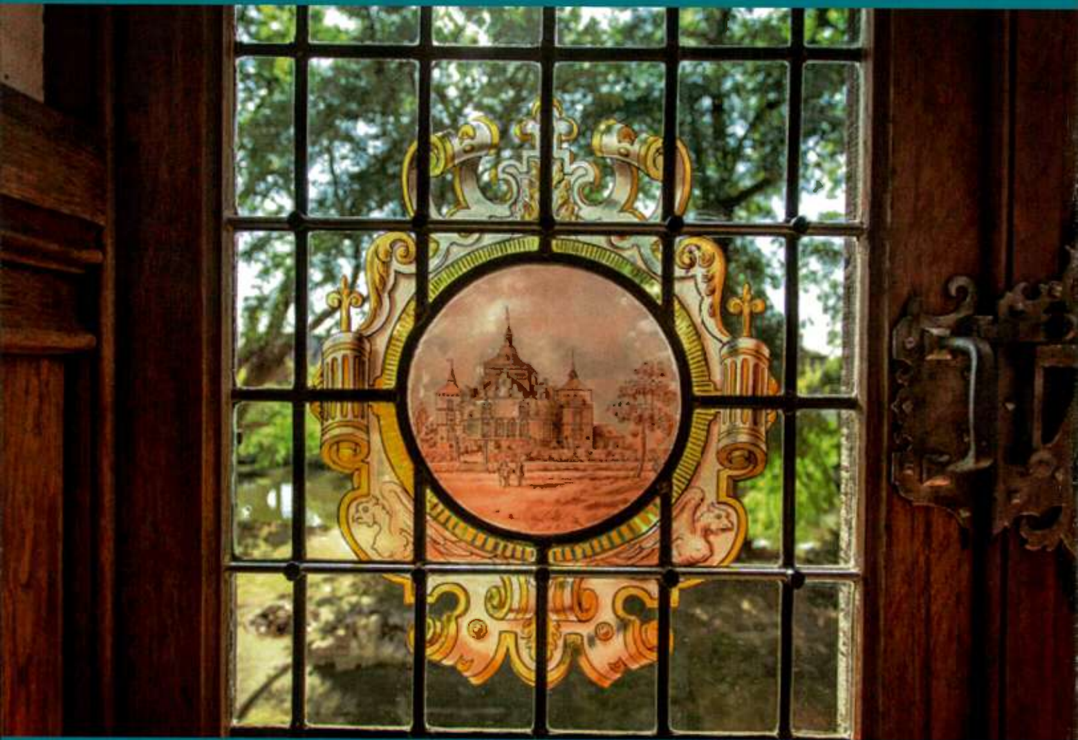
KASTEEL BORGHAREN (MAASTRICHT)