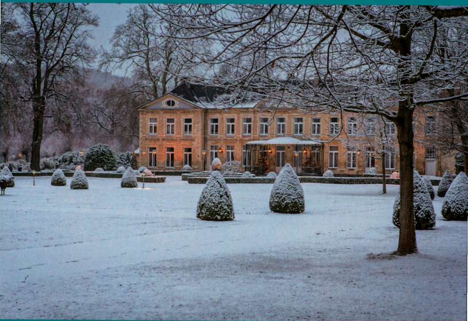
CHÂTEAU ST.GERLACH (VALKENBURG A/D GEUL)